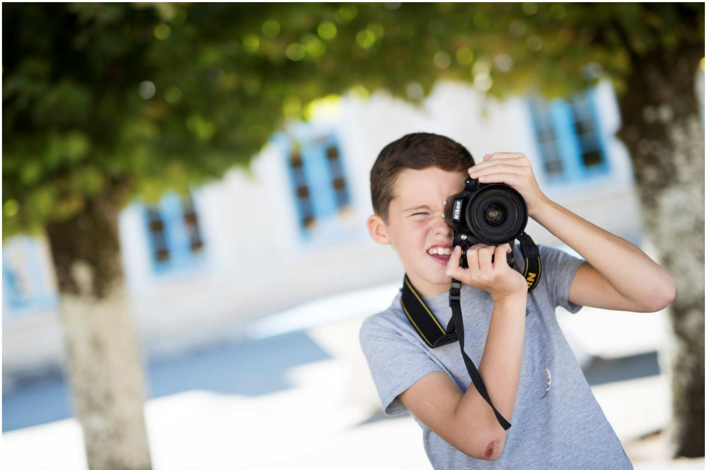
Photographies réalisées par Kenji dans le cadre des TAP avec Jimmy Beunardeau, (2018)

A Saint-Germain-de-la-Coudre, plusieurs temps périscolaires sont gérés par la CdC : les garderies (matin et soir), la pause méridienne et l'aide aux devoirs.